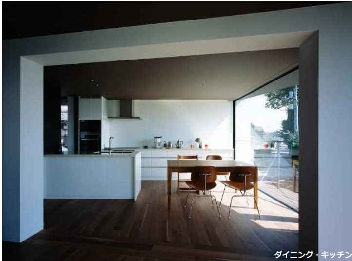
ダイニング・キッチン