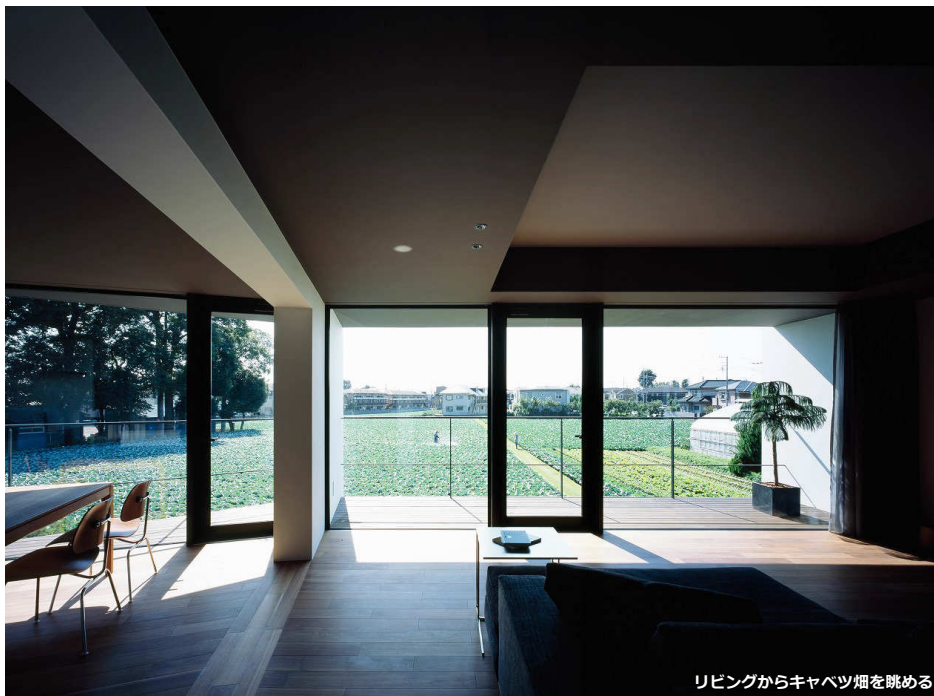
リビングからキャベツ畑を眺める