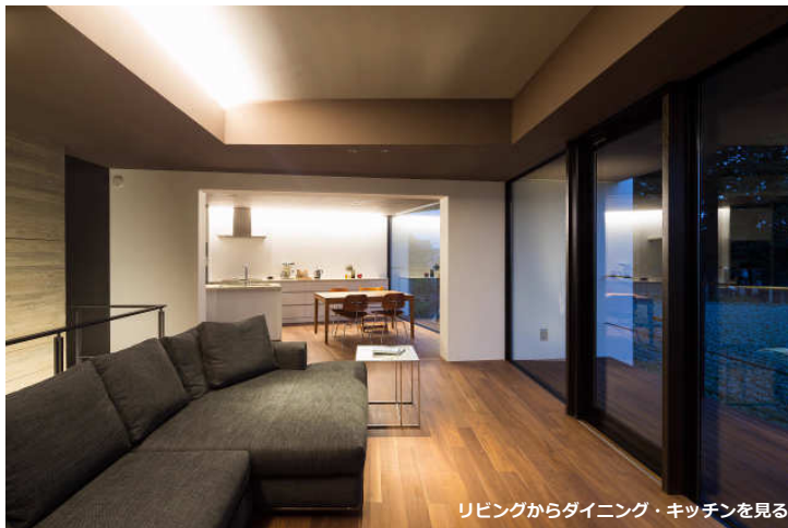
リビングからダイニング・キッチンを見る